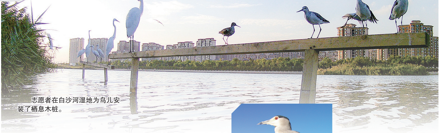
志愿者在白沙河湿地为鸟儿安装了栖息木桩。