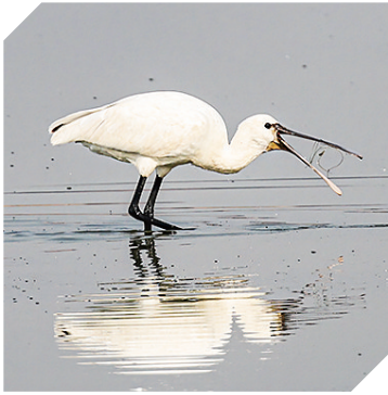
一只鸟儿正在觅食。