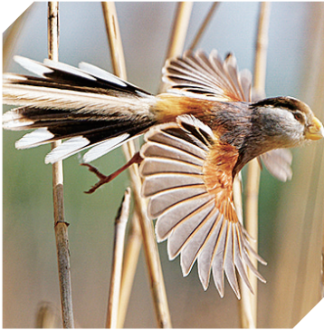
“鸟中熊猫”震旦鸦雀。