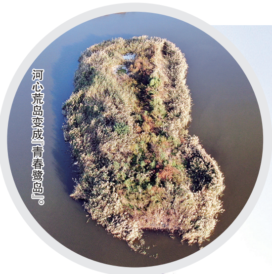
河心荒岛变成「青春鹭岛」。

联合国《生物多样性公约》缔约方大会召开 国家生态环境部发布短视频讲述青岛将荒岛变「鹭岛」故事