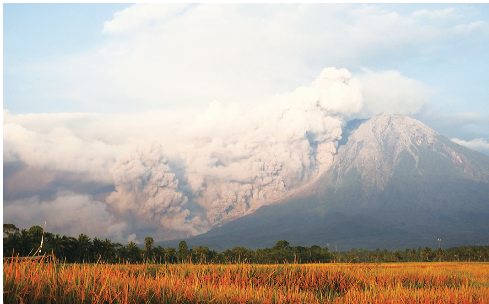
这是12月4日在印尼东爪哇省卢马姜拍摄的正在喷发的塞梅鲁火山。

日本气象厅4日早些时候警告,塞梅鲁火山喷发可能令日本遭遇海啸,但数小时后解除海啸预警。我们知道,火山喷发极易引发地震,