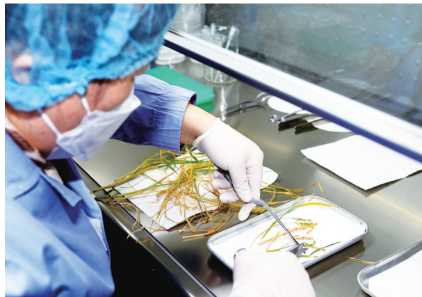
科研人员在处理从太空归来的水稻样品。

记者从中国科学院分子植物科学卓越创新中心获悉,随着圆满完成神舟十四号载人飞行任务的3位航天员平安归来,经历了120天全生命周期的水稻和拟南芥种子,也一起搭乘飞船返回舱从太空归来。我国在国际上首次完成水稻“从种子到种子”全生命周期空间培养实验。