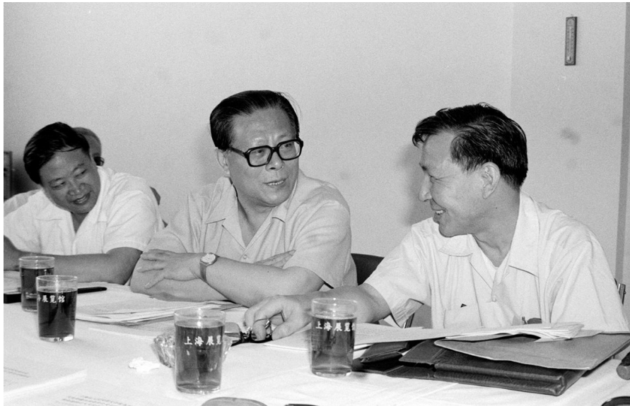
1985年，江泽民同志在上海市八届人大四次会议上。