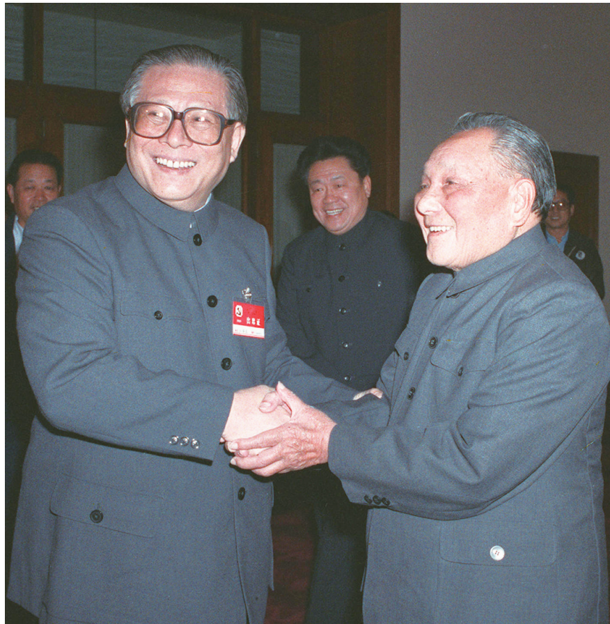
1989年11月6日至9日，中国共产党第十三届中央委员会第五次全体会议在北京召开。这是邓小平同志和江泽民同志亲切握手。