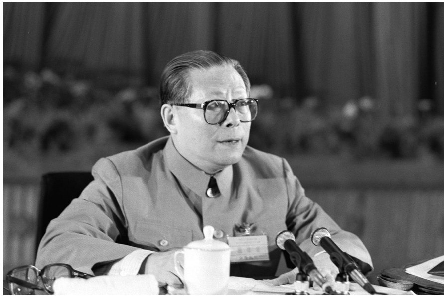
1989年6月23日至24日，中国共产党第十三届中央委员会第四次全体会议在北京召开。这是江泽民同志在会上讲话。