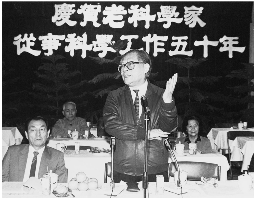
1988年10月，江泽民同志在上海庆贺老科学家从事科学工作五十年座谈会上讲话。