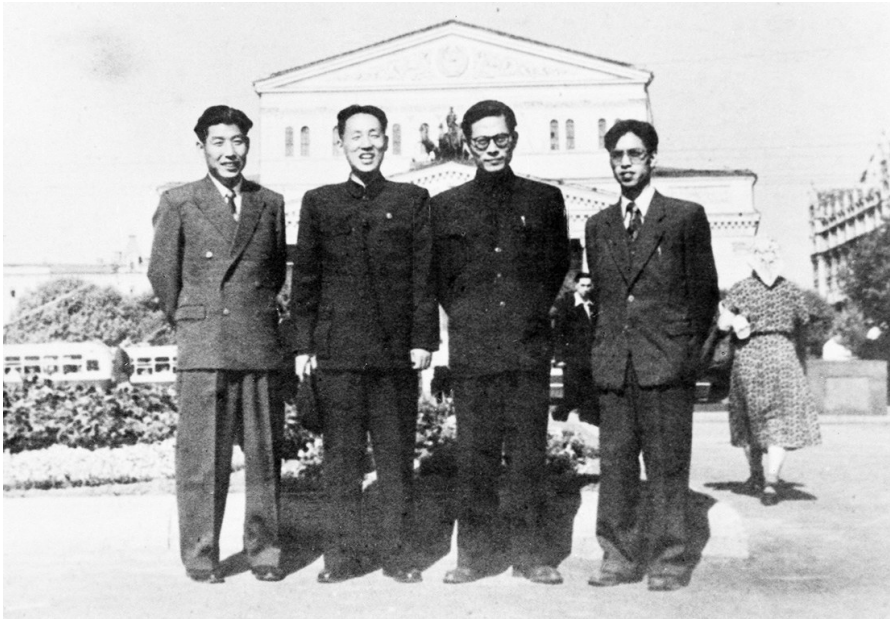
1955年至1956年，江泽民同志(右二)曾在莫斯科大林汽车制造厂实习。这是江泽民等在莫斯科合影。