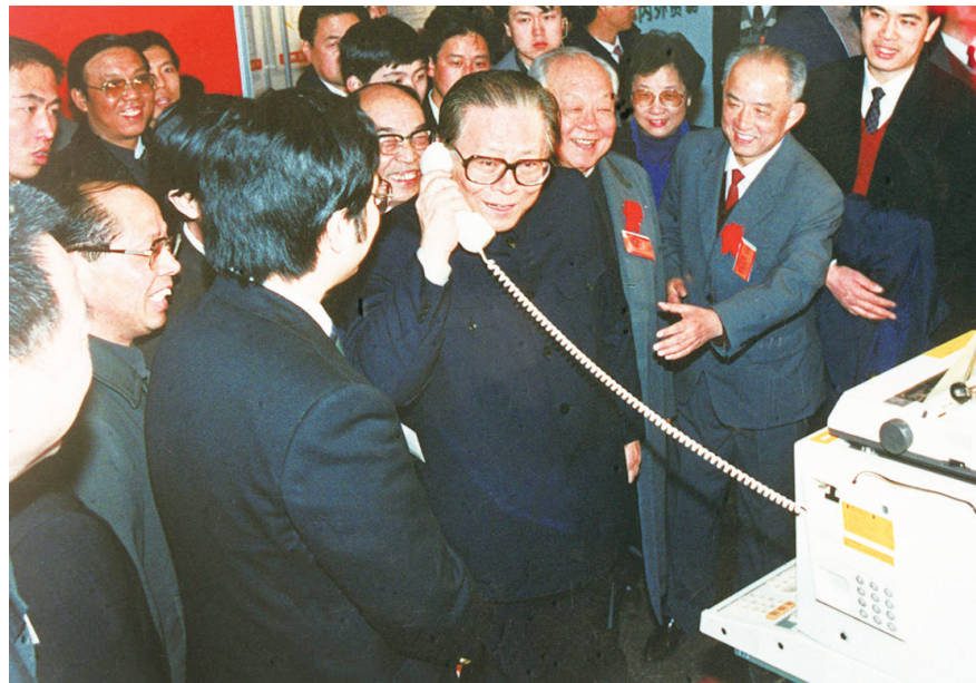
1984年5月，江泽民同志在北京展览馆举行的全国电子新产品展览会上，试用国际长途电话向远方的工作人员问候。