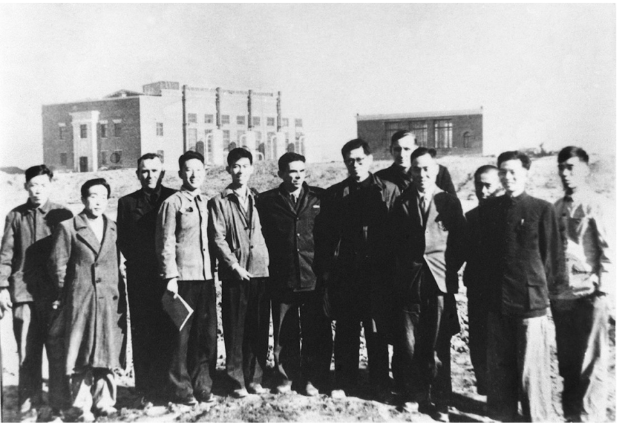
1956年，江泽民同志(左七)在长春第一汽车制造厂同援建一汽的苏联专家等合影。