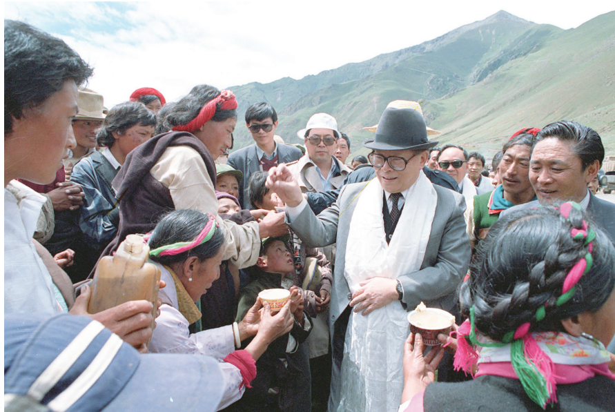
1990年7月25日，江泽民同志与藏族群众共庆望果节。