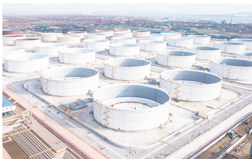
24座10万立方米浮顶油罐“拔地而起”。

早报 11月27日讯 11月26日,山东港口青岛港董家口原油商业储备库(二期)正式投产,24座10万立方米浮顶油罐“拔地而起”,新增库容240万立方米。项目投产运营后,山东港口青岛港董家口港区库区设计年存储能力将突破906万立方米,成为山东港口最大的油品罐区。