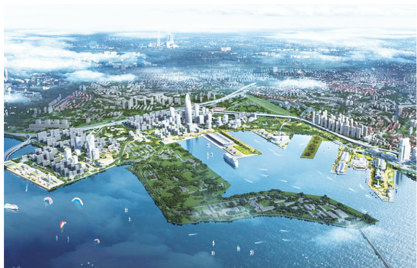
青岛国际邮轮港区规划效果图。

早报 11月27日讯 11月25日,《青岛市市北区大港小港片区控制性详细规划(北片区)》调整方案通过青岛市国土空间规划委员会审议,国际邮轮港区北片区规划建设方向进一步明确,港区改造更新进入崭新阶段。