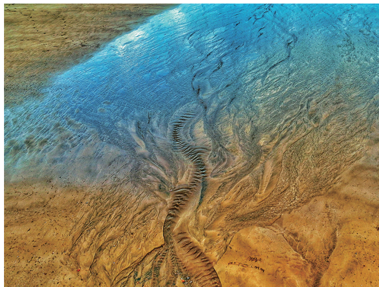
摄影《沙画》 赵军 65岁 市老干部活动中心

青岛早报银龄俱乐部会员持续招募中,在这里,你的书画艺术作品将有机会在报纸上优先刊登,还可以参与早报组织的各种讲座、采风系列活动。来吧,加入早报这个大家庭,和广大中老年朋友一起老有所学、老有所乐!