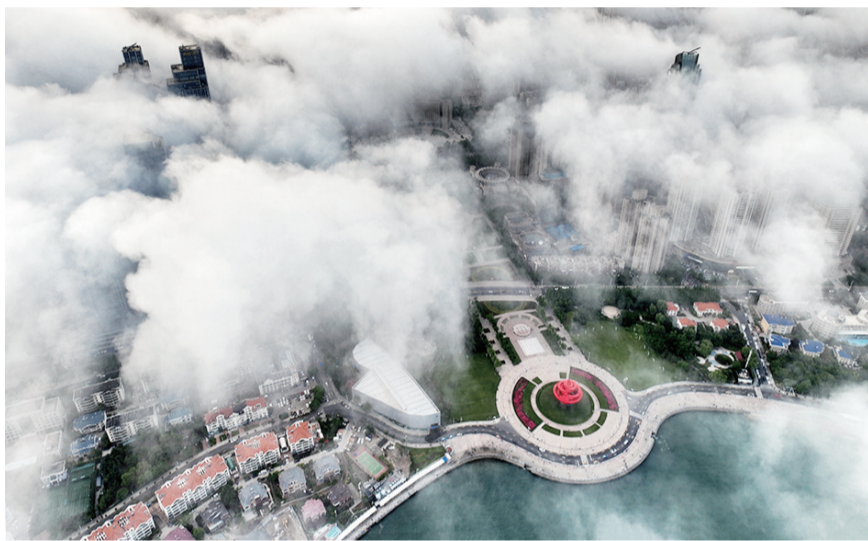
摄影《雾笼岛城》 赵春光 72岁 市老干部活动中心