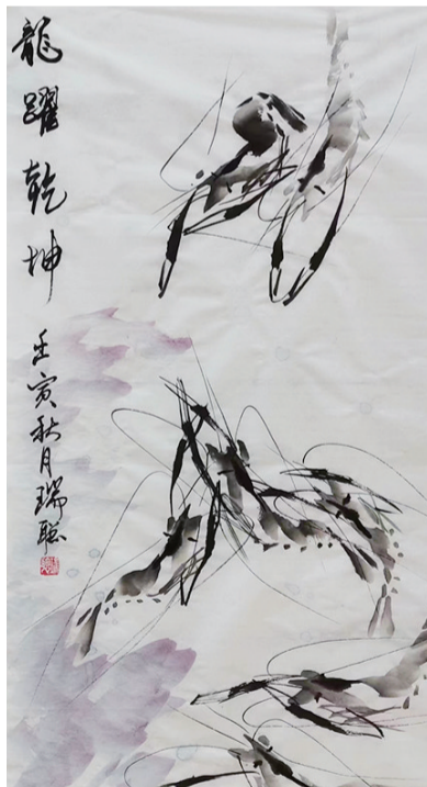
国画 王瑞聪 61岁 市军休服务中心