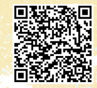
扫码观看刘栩铭讲述事情经过。视频剪辑 张孝鹏