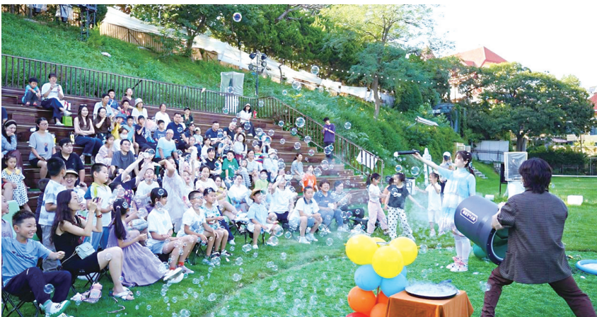
庭院艺术季活动受到市民游客喜爱。资料照片

本届庭院艺术季聚焦四大亮点。首先是高品质文化演艺供给,艺术季创新推出“惠民演出+市场化演艺”模式,既以普惠性活动让市民便捷享受高品质文化服务,也集聚专业团队与优质IP,打造沉浸式精品演出。同时,着力培育文化里院与文化街区,活化历史资源、打造沉浸式场景,植入多元演艺,让老建筑焕发新生。以“艺术家回家”主题活动为抓手,吸引艺术人才回归,留存优质作品,积淀城市文化艺术资产。此外,艺术季注重全民参与与传播,搭建全域传播矩阵,推出互动打卡活动,引导市民游客从旁观者转变为参与者、传