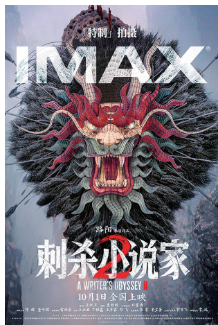
《刺杀小说家2》在IMAX等特效厅票房优势明显。