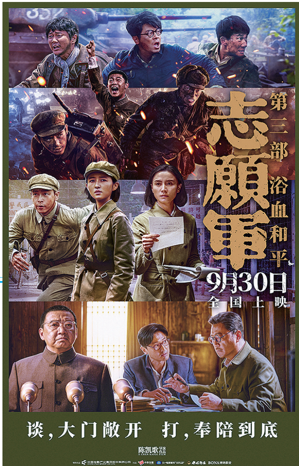
《志愿军：浴血和平》以4.8亿元票房成为国庆档新片票房冠军。