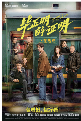
《毕正明的证明》印证了“好故事自带传播力”。