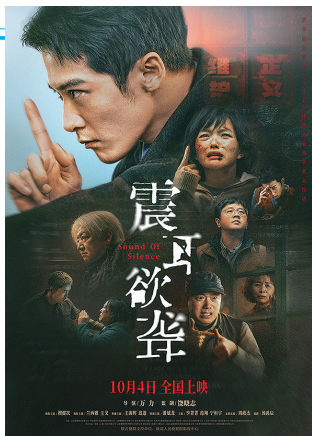
《震耳欲聋》迸发“新力量”。

作为中国电影重镇，青岛不仅取得全省票房第一的成绩，进入全国城市票房前20名，更凭借坚实的产业基底、有温度的公益实践和深入的文旅融合，成为档期内备受瞩目的电影城市样板。