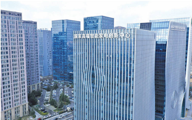
国家高端智能家电创新中心。