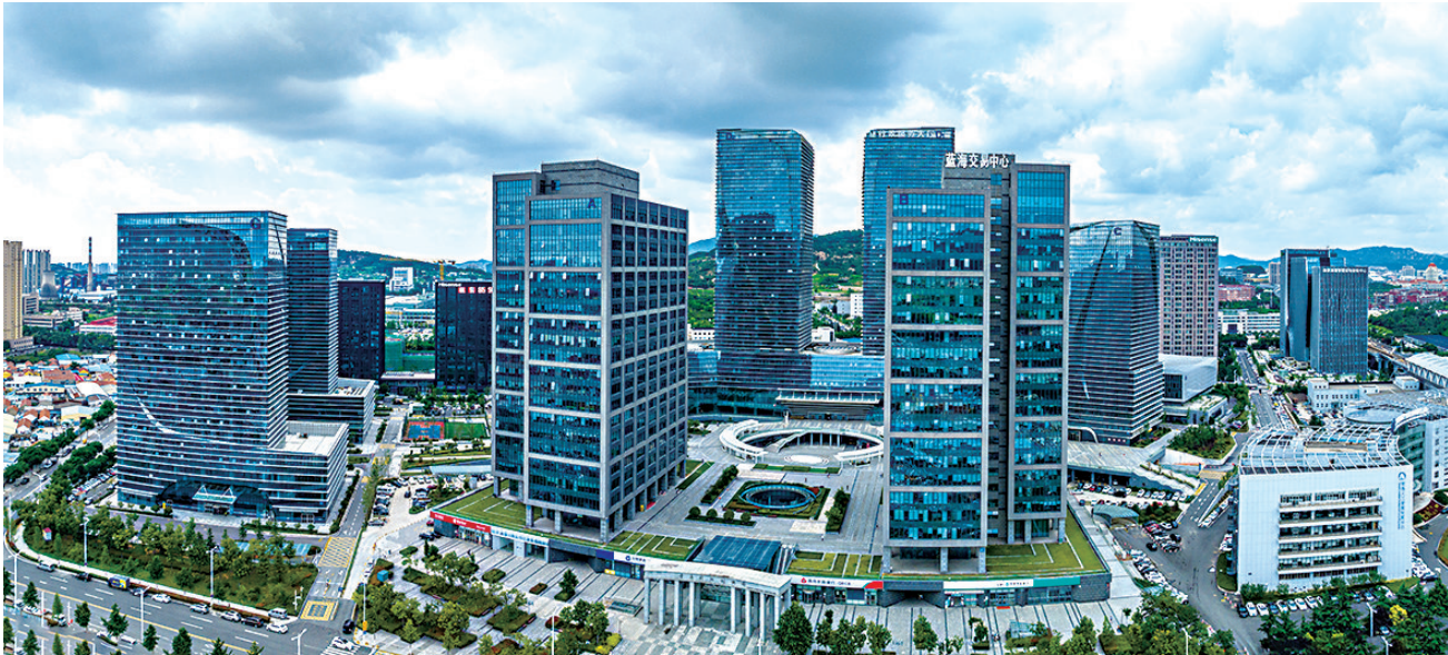
人工智能产业园智算谷核心区。

产业金融深度融合,发展格局特色鲜明,崂山区聚力构建“7+4+1”现代化产业体系,高标准建设四大新兴产业专业园区。创新平台方面,组建“企业主导、政府引导、院所共建”质量创新联合体,拥有省部级以上科研院所、实验室和工程技术研究中心51家,国内外各类研发机构100余家,高标准建设国家级虚拟现实制造业创新中心、国家高端智能化家用电器创新中心“双国创中心”——家用电器国创中心已建成九大实验室和四大公共服务平台,累计突破20项行业共性关键技术,6项达到国际领先水平;虚拟现实国创中心参与编制国家标准8项、申请专利68项,全球最大的虚拟现实试验验证平台已投入使用。金融赋能方面,崂山作为青岛财富管理金融综合改革试验区核心区,全区金融机构和类金融企业超过1400家,还在全国率先建立绿色低碳EMG联盟,建成全国首个数字人民币展示体验中心,数字金融发展位居全国前列。