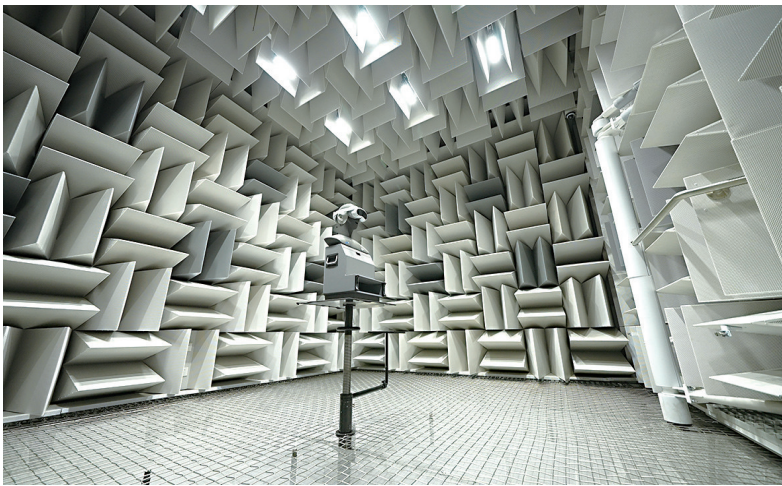
虚拟现实国创中心检测平台实验室。