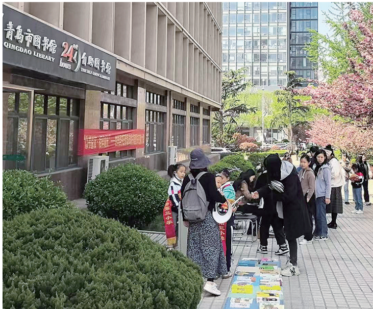
“换书大集”每年都在市图书馆举办。

阅读马拉松、换书大集、非遗拓印、电影展播、专家讲座……在第30个世界读书日来临之际，青岛市图书馆联合十区市公共图书馆，开启第十届读书节暨图书馆服务宣传周系列活动。百余场精心策划的活动，邀请市民读者共赴书香旅程。