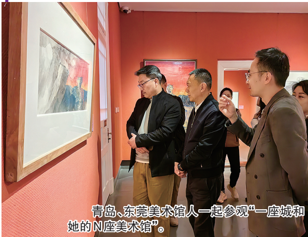
青岛、东莞美术馆人一起参观“一座城和她的N座美术馆”。

“一座城和她的N座美术馆——东莞美术馆联盟馆藏作品展(巡展)”4月18日在青岛市美术馆启幕，开启了一场跨越岭南与齐鲁的艺术对话。这场汇聚东莞12家美术馆百件精品的巡展，以“根植岭南”与“海纳百川”双篇章，在青岛老城区的百年建筑中展开一幅流动的城市文化长卷。21日，两地美术馆联盟更以座谈交流为桥，探讨艺术如何为城市发展注入新动能。