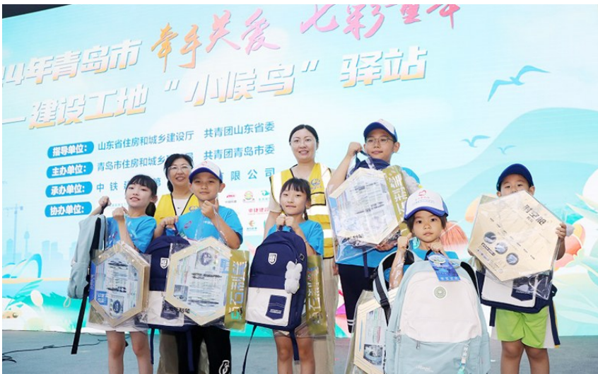
“小候鸟”和父母在青团聚。(资料照片)

建筑工地“小候鸟”驿站开班后,来自全国多地的“小候鸟”代表“飞”进了建筑工地,这些孩子的父母是奋战在岛