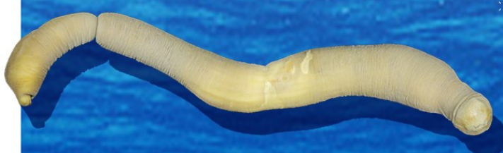
▲入选“2024年度十大海洋新物种”榜单的神龙毛皮贝。