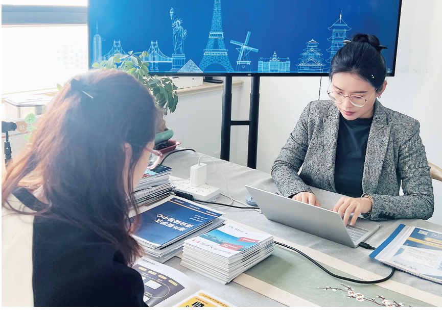
大学生在留学机构咨询留学方案。

公开数据显示，2016年至2019年，我国出国留学人数达251.8万人。从2005年到2019年，就读于美国高等教育机构