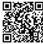
扫码了解招生简章