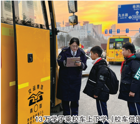
13万学子乘校车上下学。（校车供图）