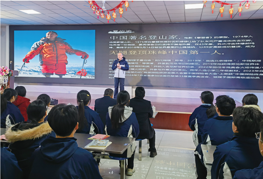
夏伯渝为学生讲述自己登山的故事。

“我想，这可能是我最后一次攀登珠峰，我一定要不顾一切冲上顶峰。在攀登过程中不管遇到什么苦难，遭受什么打击，我没有放弃，一直都在坚持。所以，人一定要有一个奋斗的目标，为了这个目标去坚持。”夏伯渝精彩的励志演讲深深吸引着学生们，一个小时的时间，掌声不断响起。夏伯渝无腿登顶珠穆朗玛峰的故事让学生们备受鼓舞。