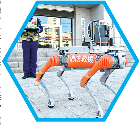
青岛消防装备的四足机器人。