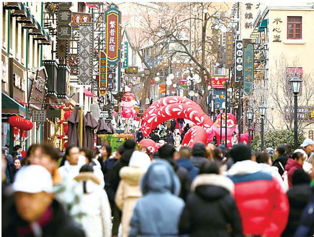
中山路历史街区人流如潮拉动消费。