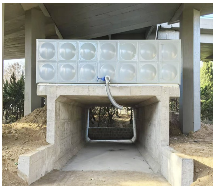
流亭立交桥、西流高架桥两座重要枢纽完成除雪保畅准备。

随着最后一车液体融雪剂灌装储存完成,流亭立交桥、西流高架桥两座重要交通枢纽公路桥梁近日已做好冬季除雪保畅工作准备。结合2024年2月持续强降雪应急处置工作经验教训,液体融雪剂撒布成为降雪量较大时快速融雪、提高融雪效果的先进处置方案。为此,市公路中心未雨绸缪、主动作为,会同城阳区公路中心充分调查研究,决定将液体融雪剂储液罐