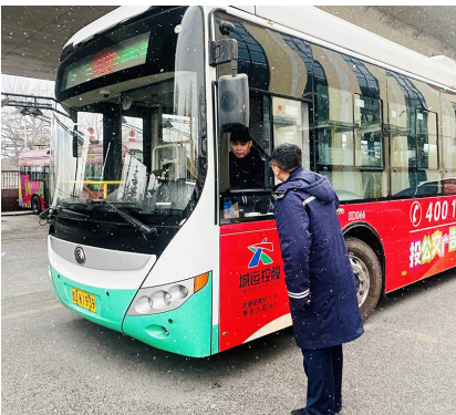
雪天注意做好驾驶员出车时的安全叮嘱。

为保障出行,春运期间,青岛城投集团旗下青岛高速集团所辖收费站足额开启所有车道,合理增派保障人员,快速处置特情。同时,科学研判事故频