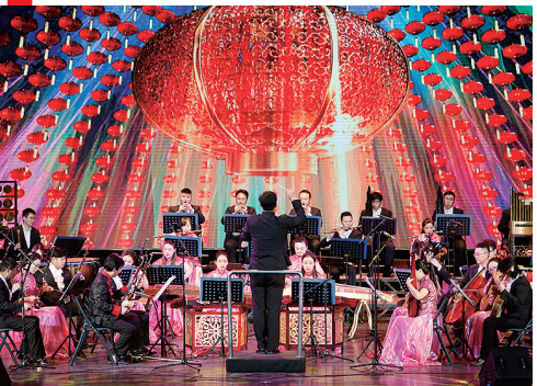
青岛市歌舞剧院将为岛城观众奏响新春民乐。