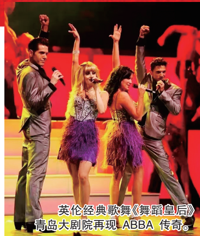
英伦经典歌舞《舞蹈皇后》 青岛大剧院再现 ABBA 传奇。

青岛有一个本土的室内合唱团，团员都是青岛的年轻音乐人，他们来自各行各业，却都有着超高的音乐专业素养。他们就是XUAN了合唱团，他们用传统唱法配上接地气的歌词，将青岛文化元素融入其中，XUAN了合唱团自成立后便圈粉无数。2月14日《城市告白计划