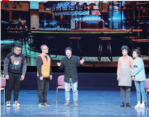
《已岁迎春·蛇年纳福相声小品晚会》 将在梦幻剧场送欢乐。