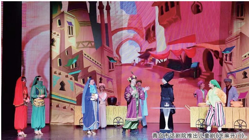
青岛市话剧院推出儿童剧《芝麻开门》。