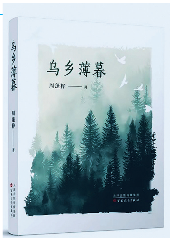
《乌乡薄暮》周蓬桦 著 百花文艺出版社 2025年1月出版

在2025年北京图书订货会上,周蓬桦的《乌乡薄暮》出现在百花文艺出版社的新书推荐中。细心的读者会发现,曾在2024年全国高考试题中出现的《霜降夜》也收录其中。