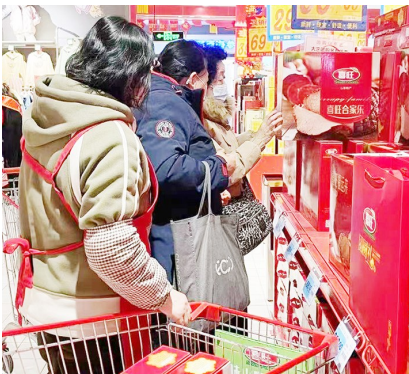
消费者在选购喜旺礼盒。