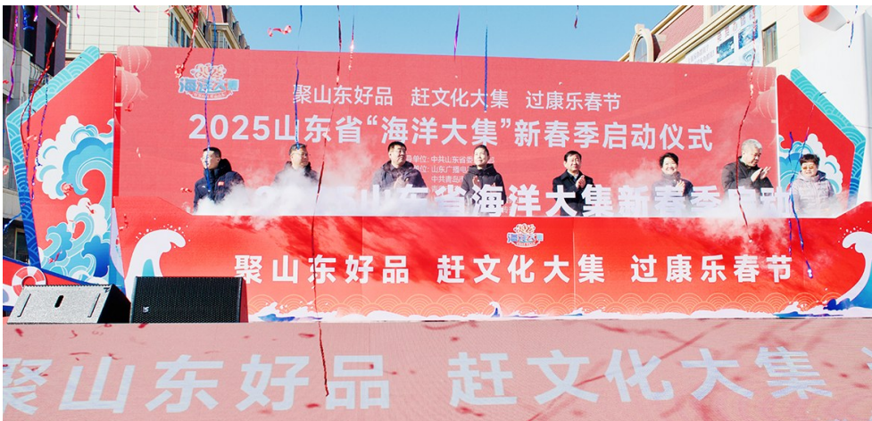
山东省“海洋大集”新春季现场。