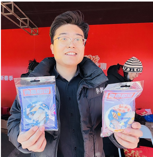
山东省“海洋大集”新春季现场，摊主展示手造产品。

护和高质量发展战略，深入挖掘传统民俗，在全省举办“黄河大集”系列活动，不断丰富群众文化生活，推动消费复苏，激活发展活力。为推动优质文化资源直达基层，山东省全面升级“黄河大集”活动，更加突出地域特色和城市特点，于腊八节当天，在济宁、聊城、青岛三地，同步举办“黄河大集”“运河大集”“海洋大集”新春季启动仪式。其中“海洋大集”由省市领导共同将取自胶东五市的海水注入象征丰收的大船中，完成新春季启动。