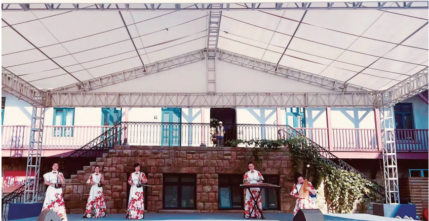
广兴里已成为集声、光、电、影、音等众多元素为一体的沉浸式文化演艺空间。

外在形式“美”、服务功能“好”、理念模式“新”，这样的公共文化空间，你感受过吗？近日，山东省文化和旅游厅组织开展了2024年山东省“最美公共文化空间”评选，共有73个公共文化空间入选，而青岛有多个公共文化空间入