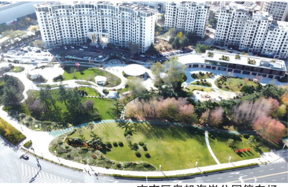
市南区奥帆海岸公园停车场。