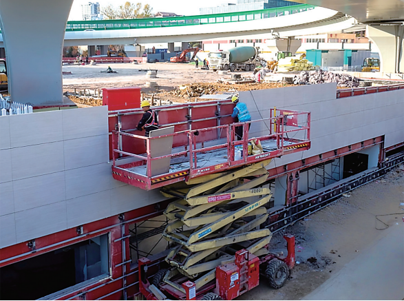
山东路-鞍山路东北象限地下停车场工程火力全开冲刺。