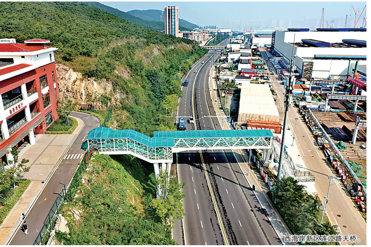
西海岸新区连江路天桥。

山东路-鞍山路东北象限地下停车场工程只是我市全力推进公共停车场建设、缓解市民停车难的缩影。今年，我市计划实施100个公共停车场建设项目，持续推进专用停车场开放共享。截至目前，实施停车场建设项目122个，完工72个、新增泊位约2.4万个，超额完成年度目标，新增数量连续5年居全省第一。三年来累计建成公共停车场项目215个，新增泊位约7.2万个，实现1571个专用停车场开放共享。 市政公用设施工作推进过程中，我市坚持需求导向，结合专项规划修编，“一域一策”开展前海一线及重点景区停车研究，精准布局停车项目。围绕东岸城区老城区、学校、医院、景区等停车难点区域，启动奥帆海岸公园、八大峡、麦岛、崂山实验学校等59个停车场建设，泊位约2.4万个，有效缓解重点区域停车难题。坚持集约利用、复合开发，创新运用“人防+、公园+、立交+、学校+、边角地+”五个加法建设模式，利用城市边角空地、棚改腾空用地、公园绿地等有限空间建设40个立体停车场，泊位约1.9万个，充分挖掘地上和地下空间建设潜力，打造集约高效用地新模式。坚持“盘活存量、应享尽享”，推动全市393个机关事业单位应开尽开，773个商场、酒店、写字楼和405个小区停车场错时开放，共享泊位约27.9万个，尤其在停车需求较大的东岸城区重点区域开放共享专用停车场518个、