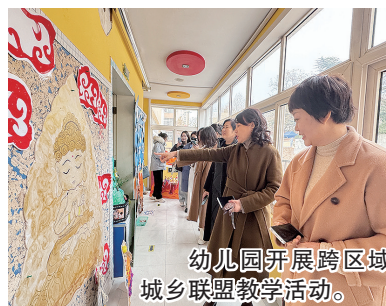
幼儿园开展跨区域城乡联盟教学活动。

本报12月12日讯 12月11日下午,青岛人民路第二小学举行“与科技同行,创美好未来”科普进校园活动。本次活动是青岛市科技馆举办的“科创筑梦”助力“蒲公英科普行动进校园”活动组成部分,通过一系列生动有趣的科技展示与互动体验,激发学生对科学技术的兴趣,培养创新思维和实践能力,为学生们播下探索科学奥秘的种子。