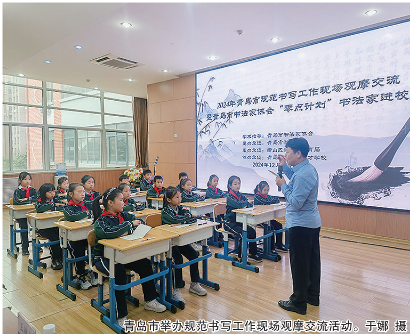
青岛市举办规范书写工作现场观摩交流活动。

据了解,青岛市各学校将紧紧围绕全面育人“十个一”项目,继续深入贯彻落实《规范书写“双姿”促进学生健康全面发展工作方案》,并以此次活动为契机,强化专业指导赋能,规范中小學生写字姿势,助力解决“小眼镜”和“脊柱侧弯”问题。(观海新闻/青岛晚报/掌上青岛 记者 于娜)