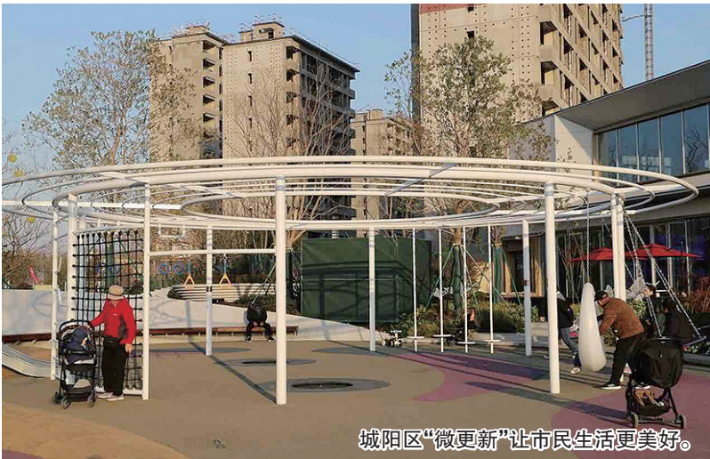
城阳区“微更新”让市民生活更美好。

环城北路景观提升项目位于环城北路东侧，占地面积广阔，总长度约270米，宽度达28米，形成了一片绿意盎然的市政绿化带。在景观带的规划中巧妙地融入了多种功能区域，以满足不同年龄段市民的需求。20米宽的