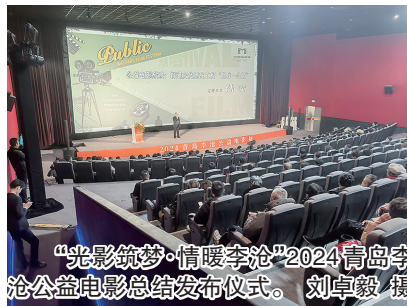
“光影筑梦·情暖李沧”2024青岛李沧公益电影总结发布仪式。

仪式上，李沧区展示了2024年公益电影工作成果：李沧区通过“三拓三聚”创新探索城区公益电影放映新模式，打造“光影筑梦 情暖李沧”公益电影巡映工作品牌；李沧区发布了公益电影展期间集中观影、公益送映和公益服务三大活动内容，为广大市民群众提供了形式多样的公益电影“观影指南”。本次活动邀请了来自不同领域的嘉宾学者，他们结合自身经历分享对于李沧区公益电影放映工作的思考。最后，与会嘉宾共同点亮“光影筑梦·情暖李沧”2024青岛李沧公益电影展，与300多名现场观众共同观看公益电影《我和我的祖国》。