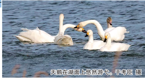
天鹅在湖面上悠然游弋。