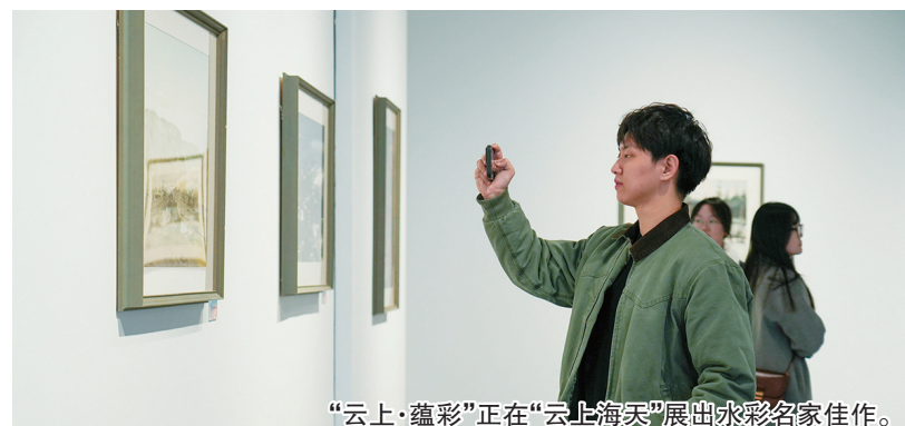
“云上·蕴彩”正在“云上海天”展出水彩名家佳作。

以60幅名家佳作勾勒中国水彩的面貌，体现中国水彩百年艺术魅力。由青岛市美术馆和青岛国信文化旅游管理有限公司主办的“云上·蕴彩——青岛市美术馆馆藏水彩画精品展”，近日在青岛云上海天艺术中心公益开展，展览