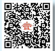
市民代表报名二维码