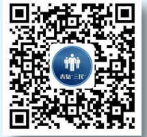
“三民”活动平台二维码