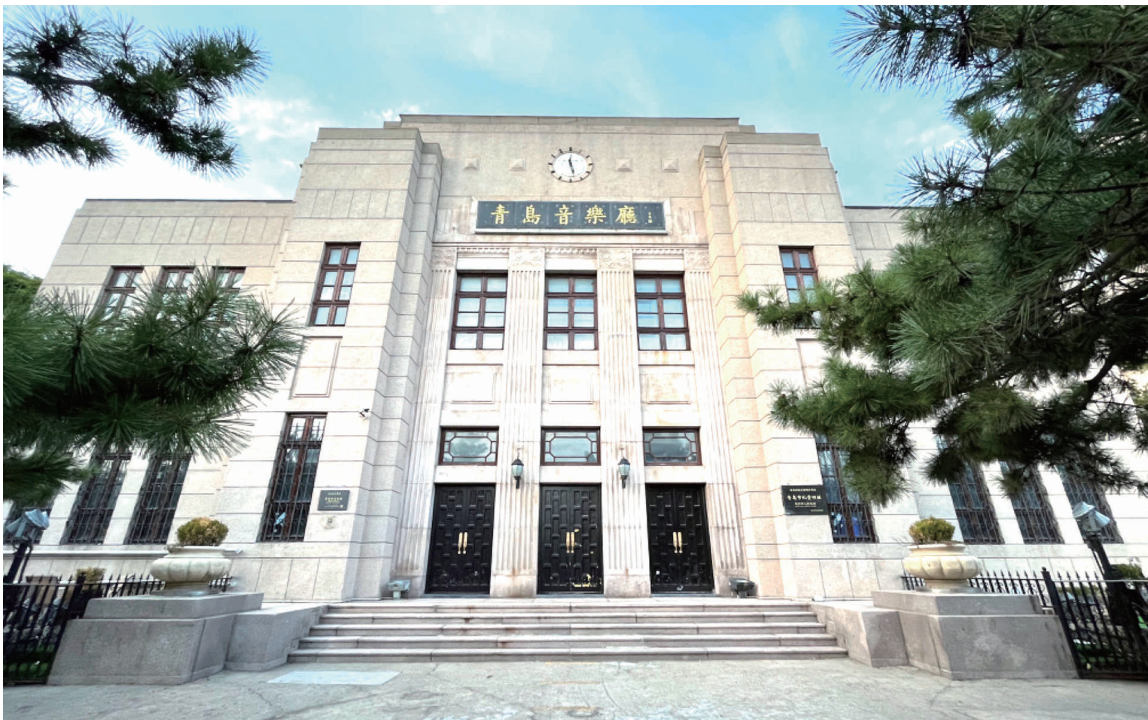
青岛音乐厅今年迎来九十岁生日。

9月的青岛湾风光旖旎，栈桥如长虹卧波，上有飞阁回澜，吸引游人无数。就在青岛湾畔，一座历史建筑今年迎来了自己的90岁生日：从公共礼堂，到群众艺术馆，到银行办公楼，到青岛地标性音乐殿堂，再到国际（青岛）打击乐演艺中心……名字几经更迭的青岛音乐厅在近几个月内进行了全新升级，并计划国庆假期正式亮相，呈现出表演形式创新化、艺术体验科技化、动线游览多元化、活动设置新颖化等特点，为市民、游客打开全新的音乐空间，也为渐成风潮的艺术场馆跨界提供了一种“新解读”。