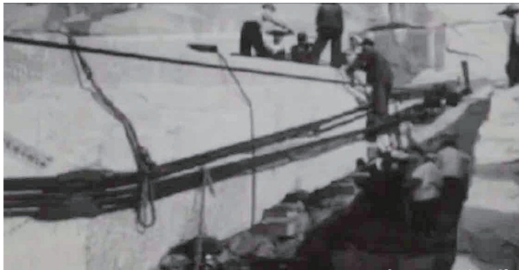
碑心石开采老照片。