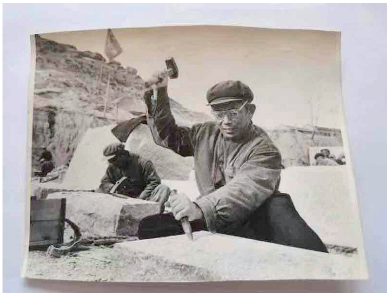
碑心石开采老照片。