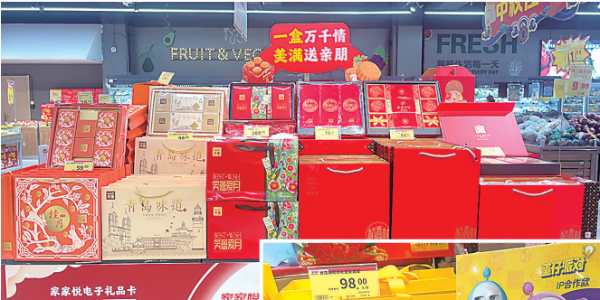
▲年轻化的包装的月饼吸引了年轻人购买。