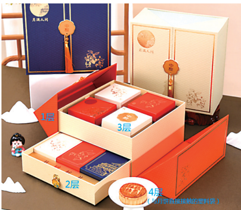
包装层数过多(超过三层)。

市场监管部门开展专项检查 有的月饼礼盒混装白酒有的月饼礼盒包装空隙率达79.55%