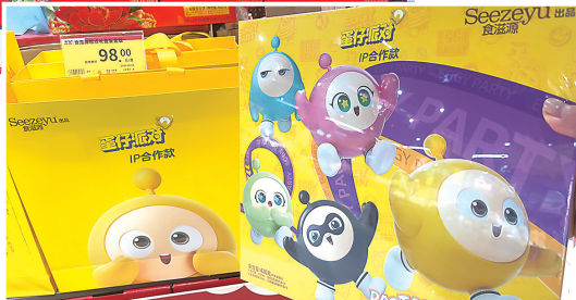
►IP盲盒款月饼受小朋友喜欢。