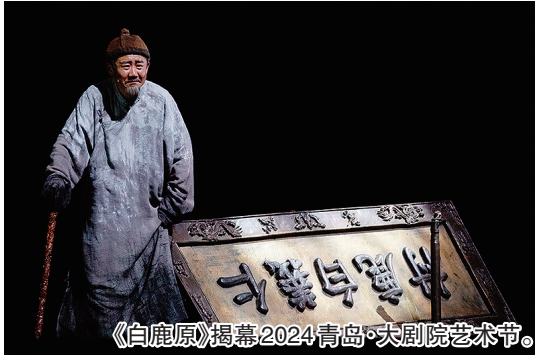
《白鹿原》揭幕2024青岛·大剧院艺术节。