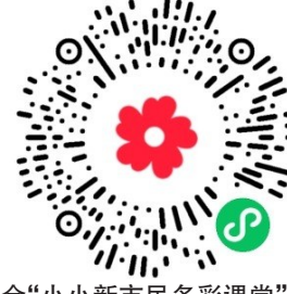
爱基金“小小新市民多彩课堂”项目