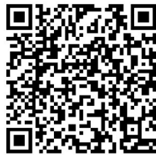
慈明筑梦乡村项目