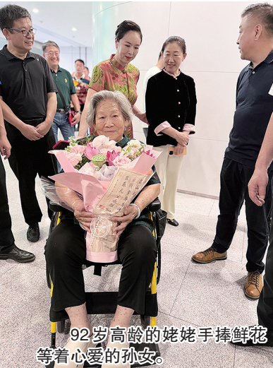
92岁高龄的姥姥手捧鲜花等着心爱的孙女。