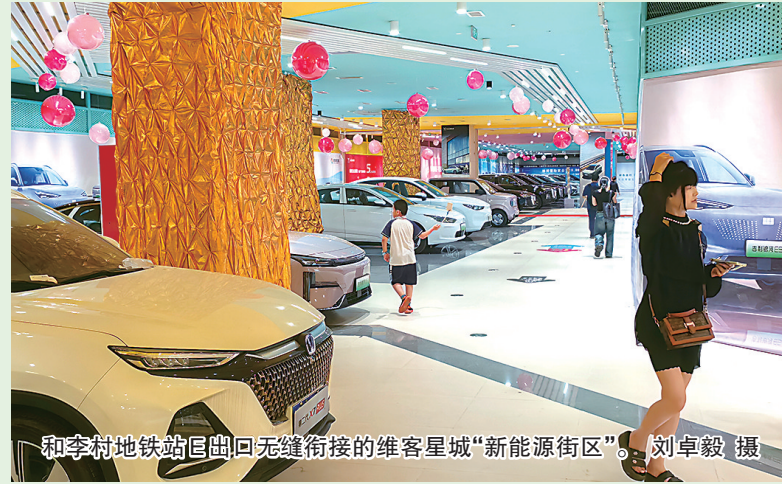
和李村地铁站出入口无缝衔接的维客星城“新能源街区”。