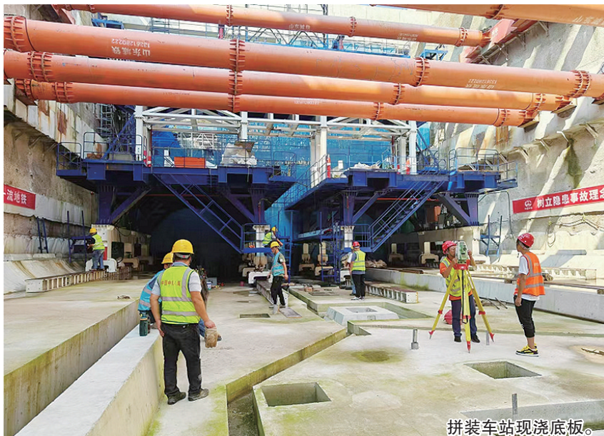
拼装车站现浇底板。

6号线二期工程共10座车站，其中装配式车站5座，占比50%。海南路站共设3个出入口，2个安全出入口，2组风亭，均为地下一层外挂式结构。车站全长185.2米，装配段长98米，共49环拼装结构。为保障拼装施工顺利推进，让“搭积木”更顺畅，前期，地铁施工各专业班组工人顶高温冒酷暑，在犹如桑拿房一般的酷热气候条件下挥汗如雨，优质高效先后完成拼装车站现浇底板施工、160吨龙门吊安装和专用拼装台车组装等工作，为海南路站实现6号线二期首座拼装车站拼装施工打好基础。