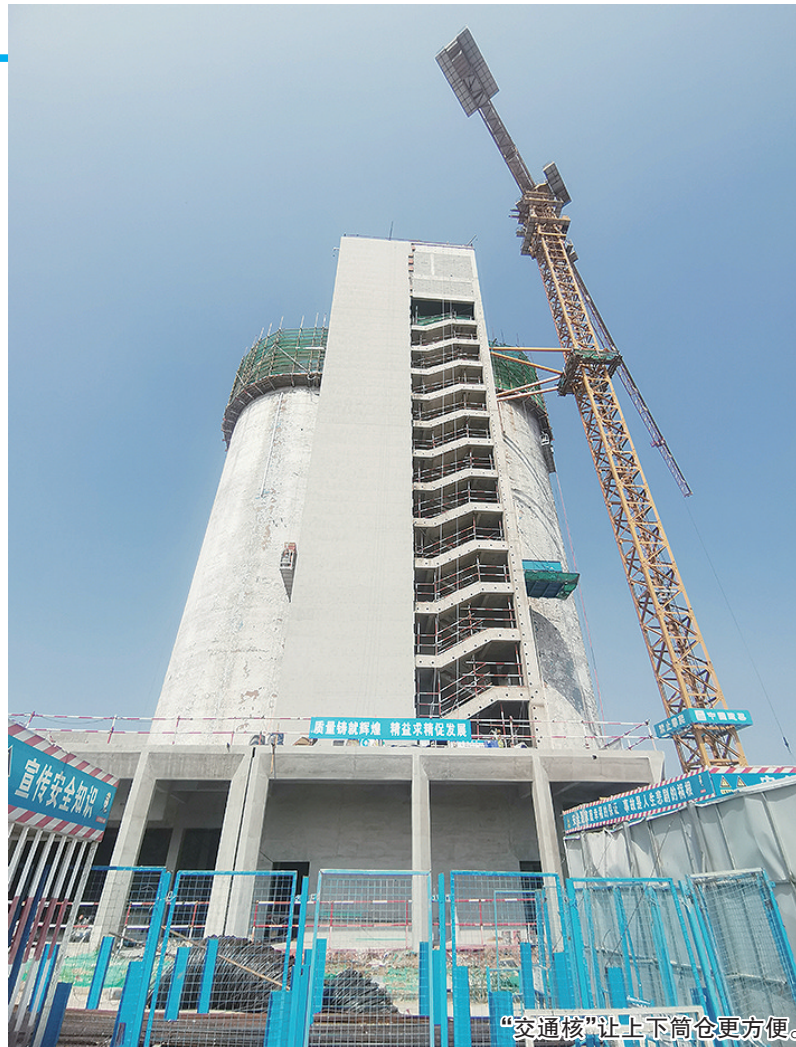
“交通核”让上下筒仓更方便。

楼山创忆空间二期总投资27125万元,项目总占地面积24.95亩,新征建设用地24.95亩,规划建筑面积41828平方米;新建研发中心一栋,科技生产中心两栋及地下车库,用于科技中介服务、其他科技推广服务业以及海洋工程技术服务等。青岛财通集团拟将项目打造成为集产业综合服务中心、科创企业培育孵化中心、新文化展示中心等功能于一体的区域发展引擎,可为产业落地提供功能性支撑,为片区产业聚集发展创造一流的软硬件环境和综合服务。项目通过“都市地标、向史而新、多维聚合、厂园一体”的四大设计理念,对工业遗存建筑的保护再利用,对新建建筑的创新研发,通过共享连廊串联园区,形成“一心、两轴、一环”的整体规划格局。