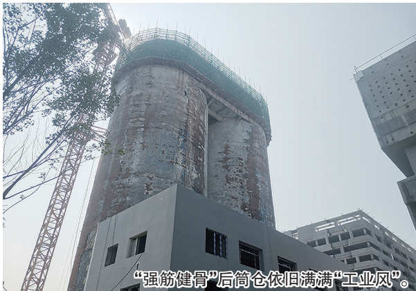
“强筋健骨”后筒仓依旧满满“工业风”。

工业文化遗产是城市发展进程中不可磨灭的一部分,是一种“特殊语言”。再过不久,昔日青岛碱厂的两个大筒仓,就将“焕新”亮相。作为2024年青岛市重点建设项目,位于胶州湾科创新区启动区的楼山创忆空间项目传来新进展,8月23日记者探访得知,由中建八局发展建设公司承建的楼山创忆空间(一期)项目“十一”前将完工。施工人员用“绣花功夫”给老筒仓“强筋健骨”的同时,还创新打造可360度观景的云顶,为北部城区再添新地标。