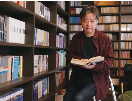
余华新作分享日常。

今年4月,莫言的微信公众号出了一篇爆款文章,标题为《莫言:今天收到了余华的投稿》,这篇投稿就是余华的散文《山谷微风》。此文一出,迅速掀起了一阵关于“风”的讨论热潮。余华在文章中引经据典,又轻盈地从经典中抽身,回忆起小时候的穿堂风和“蒲扇风”,勾起了无数人的童年记忆。