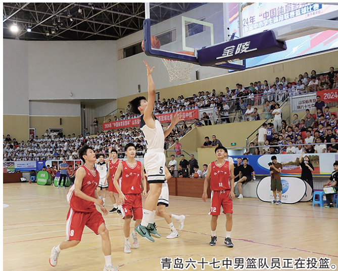
青岛六十七中男篮队员正在投篮。