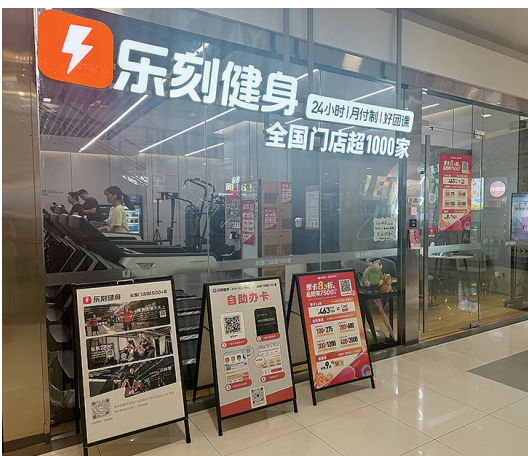
位于新业广场的乐刻健身。