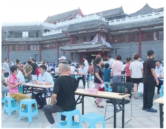
“健康夜市”深受市民的欢迎。

动，3个科室承担了23所社区卫生服务机构五种慢性病指导，专家进社区卫生服务机构定期坐诊等服务，受到了群众好评。此外，集团还开展首批中医医师、全科医师“学践式跟师学徒”等活动，培训基层医师40人。未来，海慈医疗集团还将继续致力于有效提升基层医疗卫生服务能力，持续增进群众健康福祉。 （观海新闻/青岛晚报/掌上青岛 见习记者 管浩然 实习生 肖雅昀 通讯员 范晓莘）