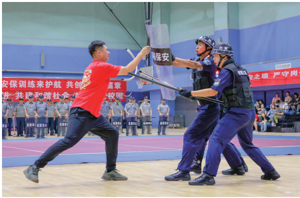
校园保安在展示制伏闯关不法分子的真功夫。

校园安全防范体系建设,全面促进校园专职保安员应急处置能力提升,突出以保安员、青年男教师为主的最小应急单元培训演练。新学期到来前,青岛市公安局充分认识当前校园安全工作面临的风险挑战,针对当前青岛市社会治安和校园安全稳定规律特点,不断完善校园安防体系建设,加强校园安保力量实战培训,严格内部安全管理,严密外围安全防控,为师生提供坚实有力的安全保障。