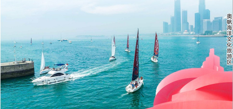
奥帆海洋文化旅游区