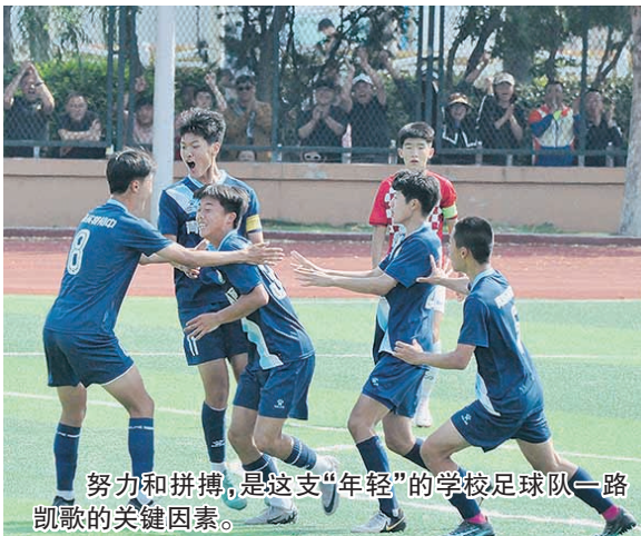
努力和拼搏，是这支“年轻”的学校足球队一路凯歌的关键因素。

在这个热辣滚烫的夏天，奥运赛场上，运动健儿们奋勇拼搏，突破自我；在青岛，一群热爱足球的“追风少年”顶着烈日驰骋绿茵，上演了首次参赛即夺冠的“热血传奇”。7月底，青岛实验初中代表我市参加山东省青少年校园足球联赛（争冠组）比赛，经过8天5场比赛的激烈角逐，最终该校男子足球队勇夺初中组冠军。冠军荣耀的背后，是青岛校园足球人才培养机制的创新，深化教体融合，赋能青少年健康成长。以青岛实验初中为例，成立仅七年的校足球队不仅在各级各类足球比赛中频频拿奖，而且不少“足球小将”踢得棒学得也好，学习成绩优异，通过足球后备人才招生计划升入优质高中。专业基础牢固、学生参与度高、探索贯穿培养模式……如今，学校已经形成了具有青岛特色的校园足球发展模式，成为“足球城”校园足球人才培养的新样板。