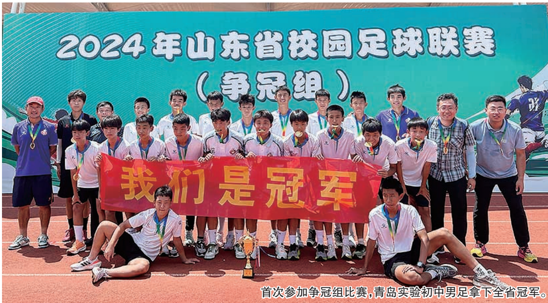
首次参加争冠组比赛，青岛实验初中男足拿下全省冠军。

在这个热辣滚烫的夏天，奥运赛场上，运动健儿们奋勇拼搏，突破自我；在青岛，一群热爱足球的“追风少年”顶着烈日驰骋绿茵，上演了首次参赛即夺冠的“热血传奇”。7月底，青岛实验初中代表我市参加山东省青少年校园足球联赛（争冠组）比赛，经过8天5场比赛的激烈角逐，最终该校男子足球队勇夺初中组冠军。冠军荣耀的背后，是青岛校园足球人才培养机制的创新，深化教体融合，赋能青少年健康成长。以青岛实验初中为例，成立仅七年的校足球队不仅在各级各类足球比赛中频频拿奖，而且不少“足球小将”踢得棒学得也好，学习成绩优异，通过足球后备人才招生计划升入优质高中。专业基础牢固、学生参与度高、探索贯穿培养模式……如今，学校已经形成了具有青岛特色的校园足球发展模式，成为“足球城”校园足球人才培养的新样板。