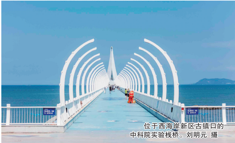
位于西海岸新区古镇口的中科院实验栈桥。