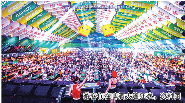
游客们在啤酒大篷狂欢。资料图