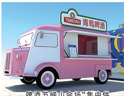
啤酒节崂山会场“集中供餐、提质抑价”(方案示意图)。