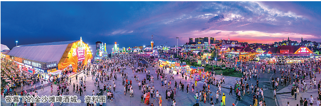
夜幕下的金沙滩啤酒城。资料图