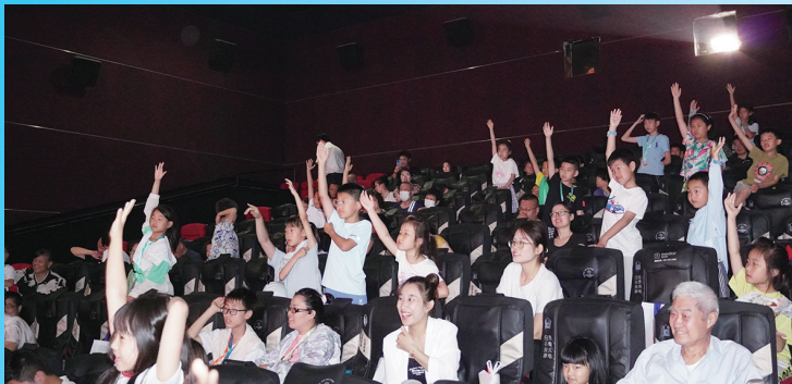
影厅内观众积极互动。