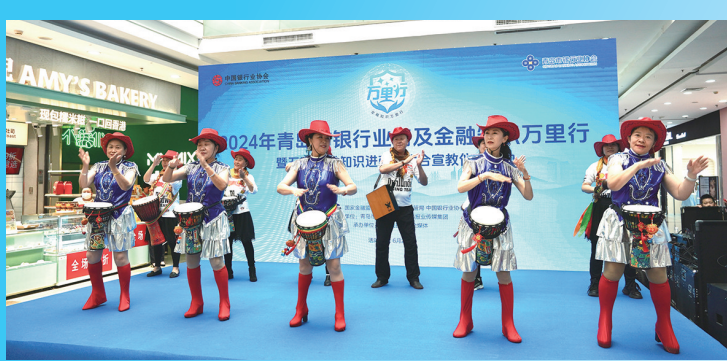
“家有艺老”艺术团体开场舞表演。

筑起“金融防火墙”，需要全民参与，更需要专业金融知识普及。 本次活动得到了万达影城的大力支持，在影厅内举办了丰富多彩的宣讲活动，现场设置金融知识宣讲、有奖问答等环节，广泛宣传非法“代理维权”的风险隐患与社会危害。主办方表示，借此活动“为岛城广大投资者们筑起一道‘金融防火墙’，切实落实好青岛市银行业普及金融知识万里行活动。” 为进一步推进金融知识的普及教育，方便市民获得金融知识和服务咨询，活动当天，青岛市银行业协会携手万达广场，搭建“金融服务联络站”，协同发力，更好地帮助广大消费者了解金融