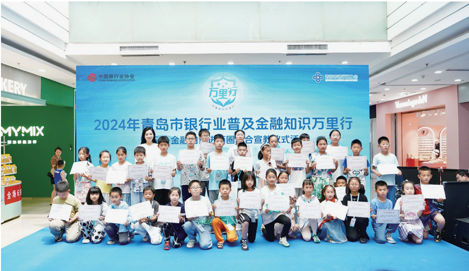
青岛晚报小记者合影。