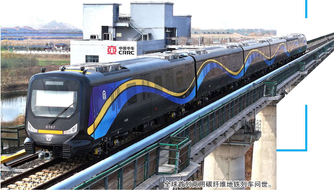
全球首列商用碳纤维地铁列车问世。