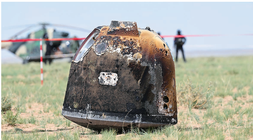
6月25日14时7分，嫦娥六号返回器携带来自月背的月球样品安全着陆在内蒙古四子王旗预定区域，探月工程嫦娥六号任务取得圆满成功。